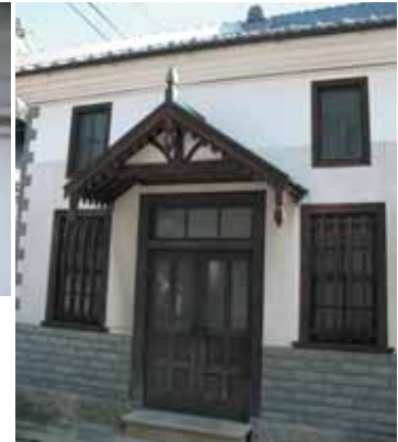
レトロな雰囲気醸し出す旧郵便局