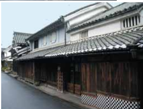
御所まち一体に町家が点在している