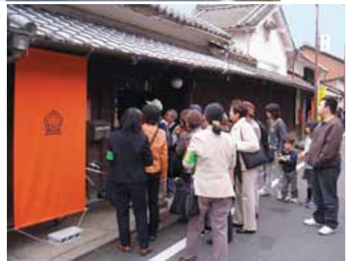
町家ミュージアムを案内するボランティアガイド