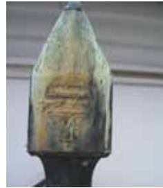
庇の上に 干マークが見える