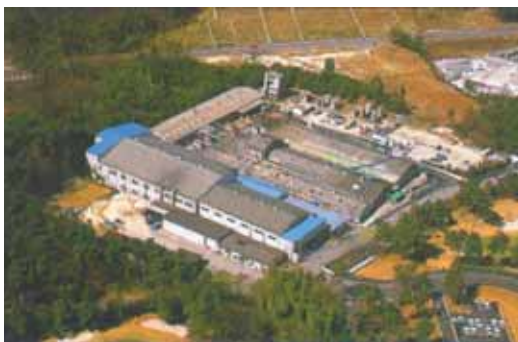
緑に囲まれた富士高分子株式会社本社