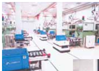
無人化工場（上）と ならやま研究所（右） 内部

平成 6 年、「ならやま研究所」建設と同時期に、関東に主として医薬品容器向けに無人化・クリーンルーム工場を建設した。24 時間稼働のこの工場は、高い品質とともにコストの低減という面でも次の時代を見据えたものである。