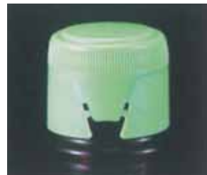
(上)「GS王冠」と「プルオープンキャップ」

そして、昭和38年、オープナー不要でシールを引れば簡単に開封できるプラスチック製の「GS王冠」を開発。金属王冠に替わる画期的なヒット製品として同社躍進の基礎となった。