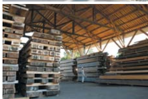
常時数万本の木材を揃える五條事業所（左下）

「林業再生のために山から出材される立木を丸ごと余すことなく使いきる」という信念のもと、まず大量の木材を買い付け、注文に即応できるよう貯蔵。現在吉野と五條に合わせて1万坪の貯木場を持ち、常時数万本以上の木材を保有している。