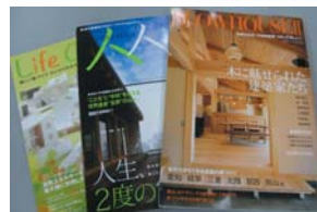
大幅なコストダウンを実現した『吉野CUBE』（左上・右上）