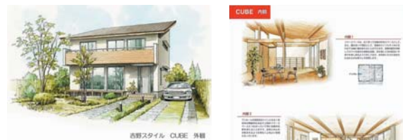
吉野スタイル CUBE 外観