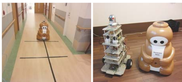
パソコンの遠隔操作により施設を移動するロボット 移動ロボットデザイン 左：本体、右：デザインカバー

そのためできるだけ誰もが親しみやすいデザインで、かつ移動ロボットの目的である見守り機能を実現する必要があることから、デザインについては、親しみやすい容姿に加工してある。