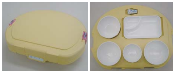
どの角度でも持ち運びが可能な構造

配食サービスにおいては、食事が冷めないように配食用の保温容器（以下、配食保温容器）が用いられることが多い。配食保温容器は、ウレタンなどの断熱材が入った容器に、食器と食べ物が入