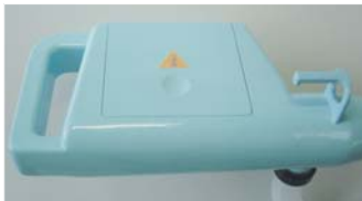
電池操作が見やすく開閉が簡単なハンドル型の柄の部分

ポンプ本体は、ハンドルと一体のモノとし、容易に持ち運びができるようにしてある。また給油や収納時における取り回しも容易となった。さらに本体を円筒状から方形状にすることにより、収納時は転がることなく安定するようになった。