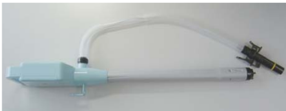
倒れにくく、石油がたれないUD化した電動式給油ポンプ

電池ボックスのふたは、軽い力でセットできるスライド方式を採用、乾電池のセットについては、脱着の容易な並列方式としてある。また電池の方向表示も大きく見やすくしている。スイッチについては、見やすい位置で、大きく、操作方法もわかりやすいように上部に設置してある。以上の取組みにより、「誰もが簡単に操作でき、取り回しのよい電動式給油ポンプ」をコンセプトとしたUDに配慮した電動式ポンプが開発された。