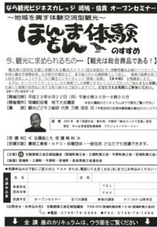
「なら観光ビジネスカレッジ斑鳩・信貴」のチラシ