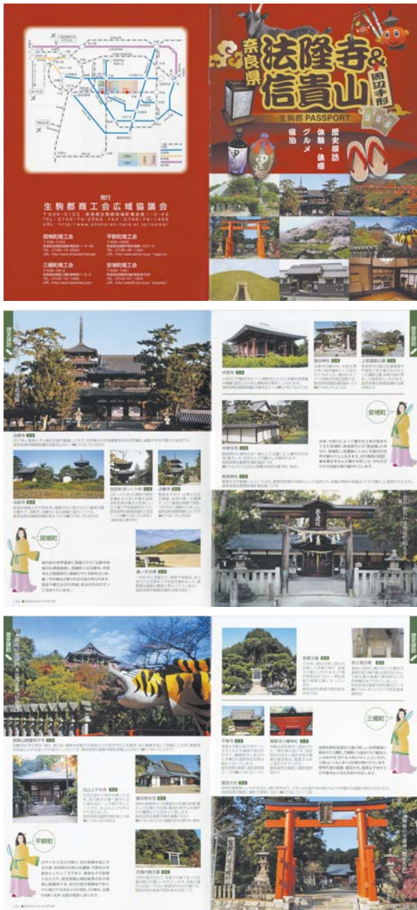
観光案内小冊子「生駒郡 PASSPORT」

また、WEB と合わせて、生駒郡 4 町の観光地、宿泊施設、食事処などを掲載した紙媒体の観光冊子「生駒郡 PASSPORT」を平成 22 年に発行（当初発行部数：12,000 部）し、商工会や観光案内所などで無料配布している。