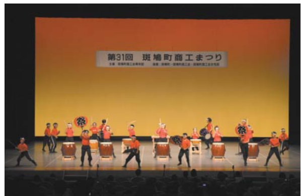
斑鳩町商工まつりでの和太鼓演奏風景

「斑鳩町商工まつり」は昭和54年に始まった地域の行事のひとつで、実行委員会と斑鳩町商工会青年部が中心となり企画・運営している。今年、31回目という歴史を数えるが、始まった頃の内容は、カラオケ、野菜や地元物産の即売などといったもので、まつりの参加者に買い物などで楽しんでもらい、地元商工業者や商店街が日ごろの謝恩を込めて、皆様に利益を還元するといった趣旨のものだった。しかし数十年前から、社会情勢や産業構造の変化に伴って消費が低迷し、地元の商工業者に危機感がみられるようになっていった。そこで主催者である商工会青年部では新たな展開を模索・検討して、商工まつりの改革を進めていった。