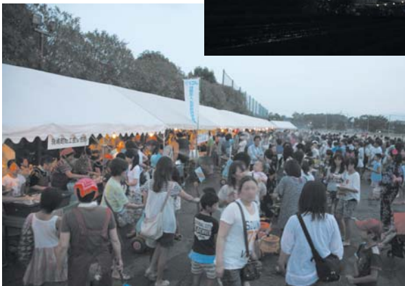
会場では花火も打ち上げられ多くの人々が訪れた

これからの斑鳩町商工まつりは「学び」を基本コンセプトにと考えている。主催する斑鳩町商工会青年部では、「これからは『町民の誇り』を築