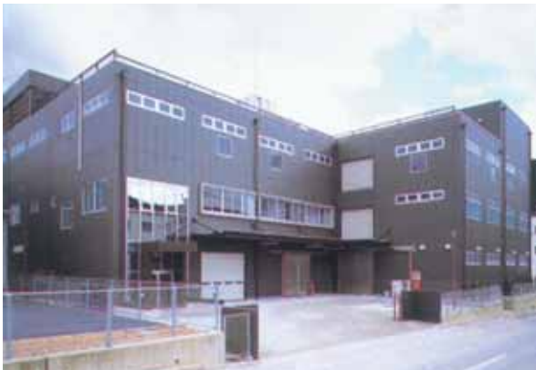
株式会社舛田の本社・工場