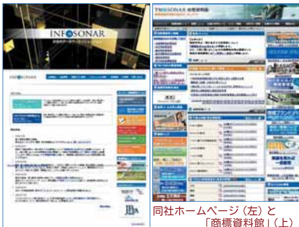
同社ホームページ（左）と「商標資料館」（上）

URL：http://www.info-sonar.co.jp/ E-mail:info@info-sonar.co.jp