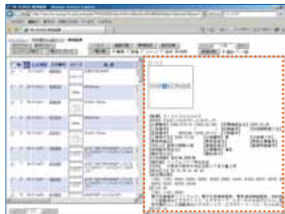
「TM-SONAR 書誌」と完全連動した結果出力